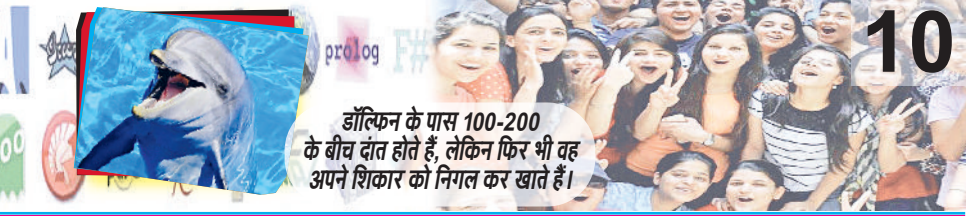
डॉलफिन के पास 100-200 के बीच दांत होते हैं, लेकिन फिर भी वह अपने शिकार को गिना कर खाते हैं।