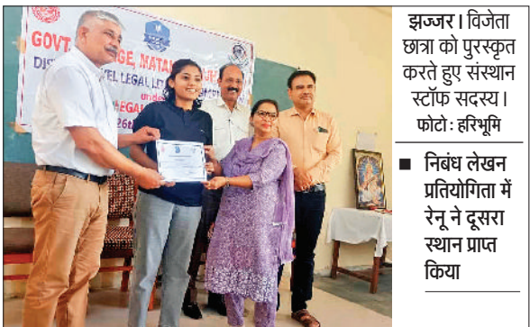
इज्जर। विजेता छात्रा को पुरस्कृत करते हुए संस्थान स्टाफ सदस्य।