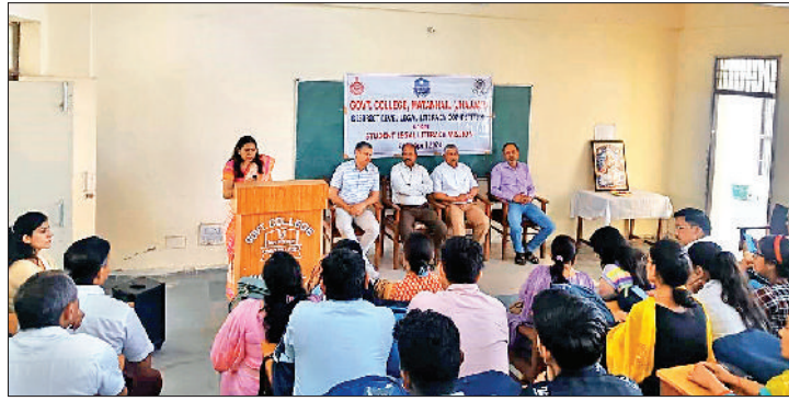
इज्जर। प्रतियोगिता कार्यक्रम के दौरान मौजूद शिक्षक एवं विद्यार्थी।