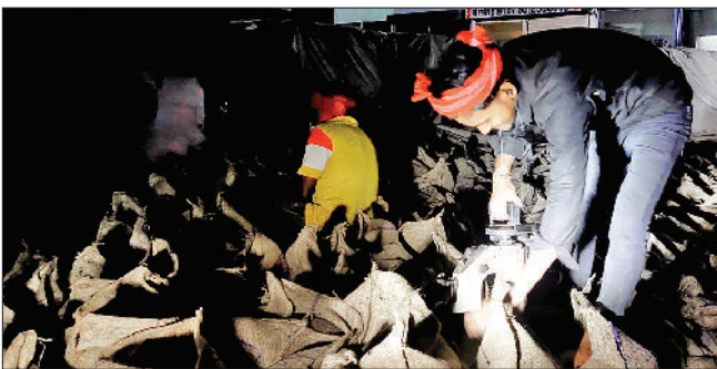
झंजार। रात के समय उठान व पैकिंग कार्य में जुटे श्रमिक व हल्की बूंदाबांदी के बीच गेहूँ को तिरपाल से ढकते हुए श्रमिक।

घंटों के अंदर किसान को फसल का भुगतान कैसे हो पाएगा जब किसान की फसल को गोदाम तक ही नहीं पहुंचाया जा रहा।