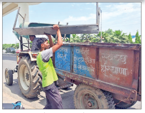
बहादुरगढ़। अवैध दुकान लगाने वालों को चेतावनी देते नप कर्मचारी और रेहड़ी वालों का सामान उठाकर ट्राली में डालते नप कर्मचारी।

नगर परिषद अधिकारियों को पिछले कुछ दिनों मिल रही थी अतिक्रमण की शिकायतें हरिभूमि न्यूज ►► बहादुरगढ़। अवैध दुकानें हटाई गईं। सड़क पर रखा सामान जब्त किया गया। इस दौरान रेहड़ी वालों में हड़कंप मच गया। अतिक्रमण हटाओ कार्यक्रम के दौरान नप अधिकारियों ने कड़ी चेतावनी देते हुए कहा कि सड़क पर अवैध कब्जा करने पर सख्त कार्रवाई होगी। दरअसल, नगर परिषद अधिकारियों को पिछले कुछ दिनों से शिकायतें मिल रही थी कि देवीलाल पार्क के साथ सड़क