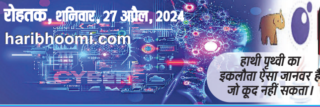
हाथी पृथ्वी का इकलौता ऐसा जानवर है जो कूद नहीं सकता।