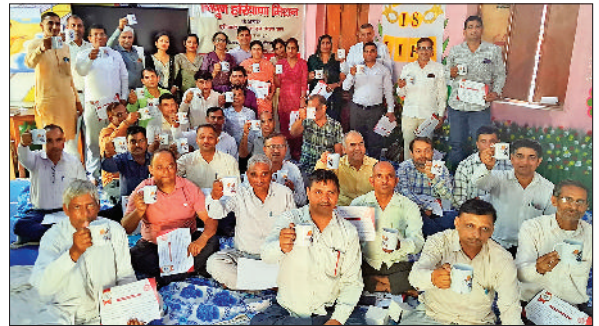
इज्जर। प्रमाण पत्र व कॉफीमग दिखते हुए प्रतिभागी शिक्षक।