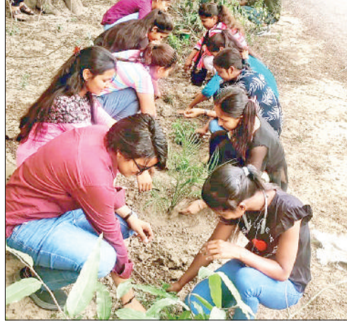
हरिभूमि न्यूज ►► बहादुरगढ़। स्वयंसेवकों ने पौधारोपण किया।

शहर के राजकीय महाविद्यालय में एक दिवसीय एनएसएस शिविर का आयोजन किया गया। कार्यक्रम के अंतर्गत एक दिवसीय एनएसएस शिविर का आयोजन किया गया। कार्यक्रम के अंतर्गत एक दिवसीय एनएसएस शिविर का आयोजन किया गया। कार्यक्रम के अंतर्गत एक दिवसीय एनएसएस शिविर का आयोजन किया गया।