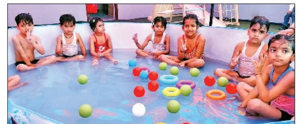
इज्जर। पूल पार्टी में मस्ती करते हुए नन्हें विद्यार्थी।

पुलिस के अनुसार मामले की सूचना 25 अप्रैल गुरुवार रात करीब 12 बजे मिली थी। घायल महिला को अस्पताल ले जाया गया। फूछताछ में उसने बताया कि रात करीब पौने 11 बजे वह फूल मंडी से छतरपुर पहाड़ी इलाके में पैदल जा रही थी। फुटपथ पर उसके पीछे दो युवक कुत्ते के साथ चल रहे थे। वह कुत्ते से डर गई। उसी बीच एक युवक ने महिला को पीछे से दबोच लिया और दीवार से सटा दिया। महिला का पर्स छीन लिया। पर्स में आठ सौ रुपये और चांदी की अंगूठी थी। उन्होंने महिला के कपड़े भी फाड़ दिये। महिला के सिर पर पत्थर से वार कर दिया। इसके बाद दोनों आरोपी युवक फरार हो गये। महिला छतरपुर इलाके में किराये पर रहती है। पुलिस ने सीसीटीवी फुटेज और लोकली इंटेलीजेंस के जरिये दोनों संदिग्धों का पता लगा उन्हें पकड़ लिया। दोनों लेबर और ड्राइविंग का काम करते हैं और रशों के आदी हैं। घटना के समय भी दोनों नशे में थे।